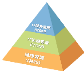
三位一体的解决方案